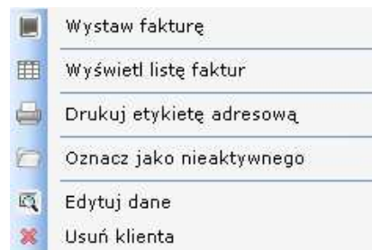
Rys. 2 Menu kontekstowe dla klienta